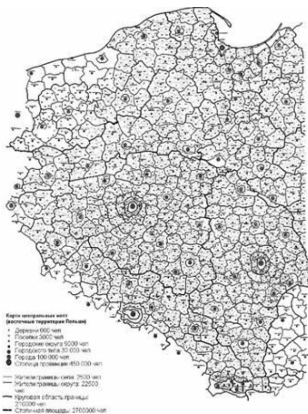
Рис. 1. Карта центральных мест, предложенная В. Кристаллером в 1941 г.

Такой подход в исследовании территориальной организации населения хозяйства стал применяться, начиная с XIX в. При этом наиболее важное значение до настоящего времени имеют три теории: модель размещения сельского хозяйства И. Г. Тюнена (1826), теория штандорта А. Вебера (1909), теория центральных мест Вальтера Кристаллера (1933) (рис. 1) и Августа Леша (1954).